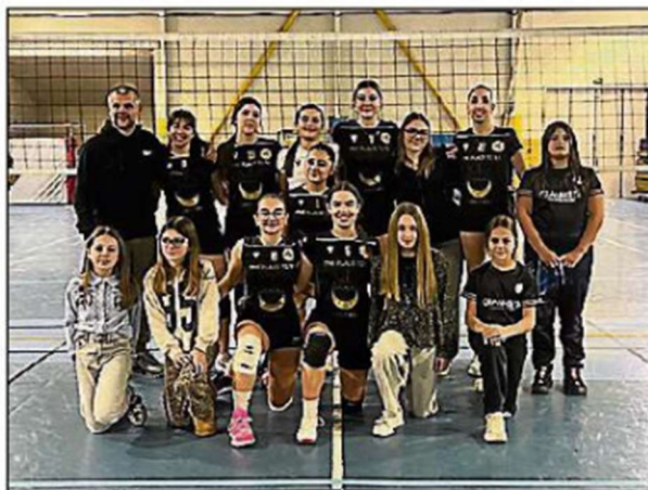
Les équipes régionales du club.

précédente par une victoire. Les M18 régionales remportent leur match contre Agde sur le score de 3/0. Les deux premiers sets sont bien maîtrisés par les Pérignano-coursannaises et le troisième est arraché 31/29 contre des Agathoises accrocheuses. L'équipe conserve sa première place et va préparer le déplacement à Grenade le week-end prochain pour disputer le 4 e tour du challenge de la coupe de France. Les seniors féminines recevaient en suivant leurs homologues de Générac pour tenter de rester invaincues dans ce championnat.